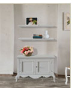
Art. 1540 - pag. 50 Art. M-97 - pag. 50