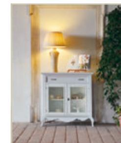
Art. 1500 - pag. 38