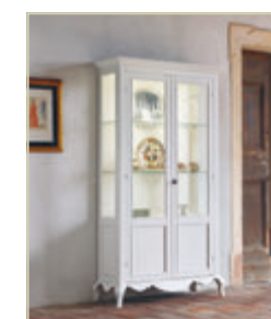
Art. 1526 - pag. 52