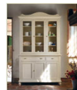
Art. 1210 - pag. 16 Art. 1242C - pag. 16