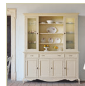
Art. 1510 - pag. 47 Art. 1515 - pag. 47