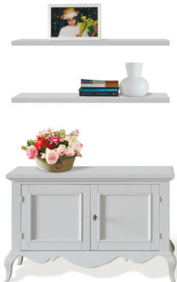
Art. 1540 base 2 antine pannellate sideboard 2 paneled doors L. 106 P. 49,5 H. 65 fin. zinco