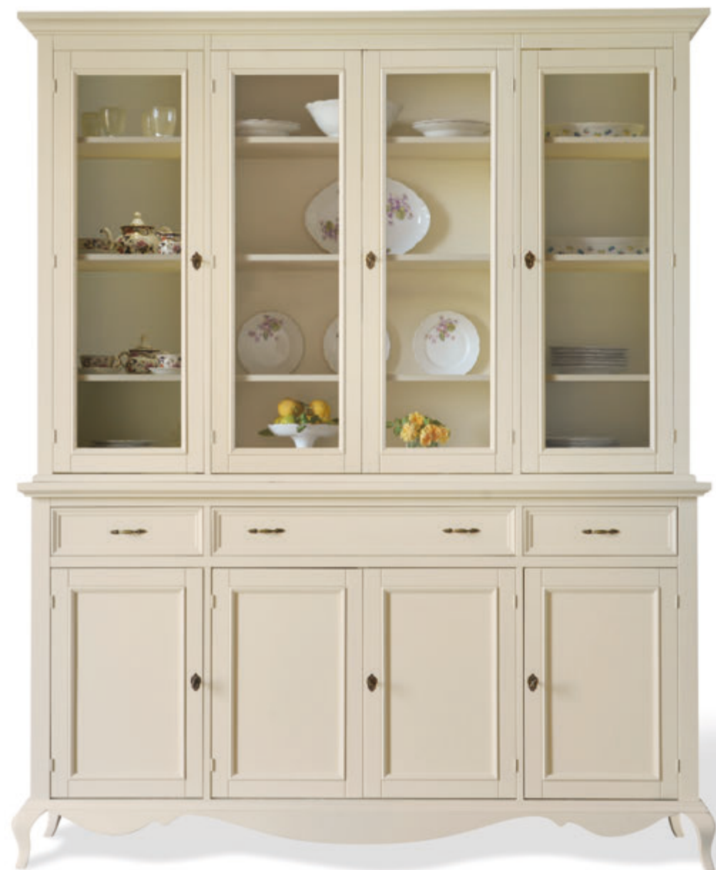
Art. 1514A alzata 4 ante vetro (ripiani regolabili) raised 4 glass doors (adjustable shelves) L. 197 P. 41 H. 126 fin. sabbia