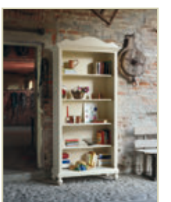
Art. 1266C - pag. 26