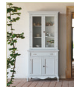
Art. 1500 - pag. 40 Art. 1511A - pag. 40