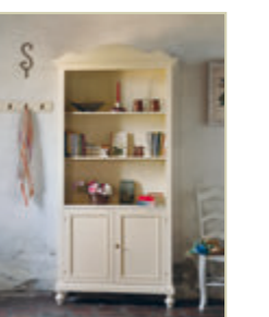
Art. 1264C - pag. 27 Art. 1270 - pag. 27