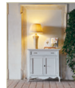
Art. 1501 - pag. 39