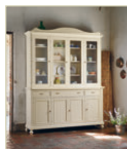
Art. 1220 - pag. 18 Art. 1250C - pag. 18