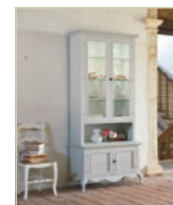
Art. 1540 - pag. 48 Art. 1542 - pag. 48