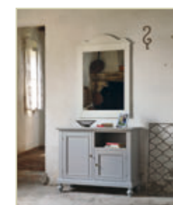
Art. 1268 - pag. 25 Art. 1320 - pag. 25