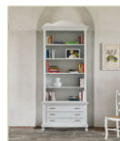
Art. 1272 - pag. 14 Art. 1284C - pag. 14