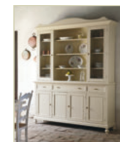
Art. 1220 - pag. 21 Art. 1254C - pag. 21