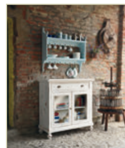
Art. 1201 - pag. 7 Art. 1276 - pag. 7