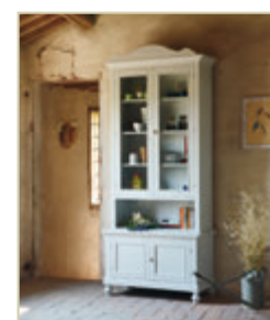
Art. 1273 - pag. 14 Art. 1280C - pag. 14