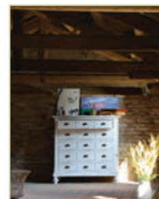
Art. 1205 - pag. 8