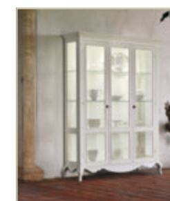
Art. 1528 - pag. 54