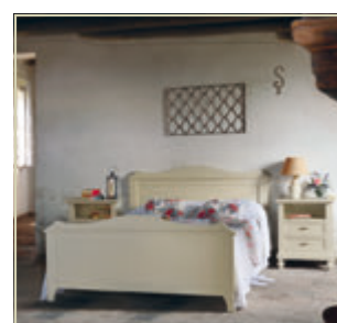
Art. 1310C - pag. 30/31 Art. 1301 - pag. 30/31