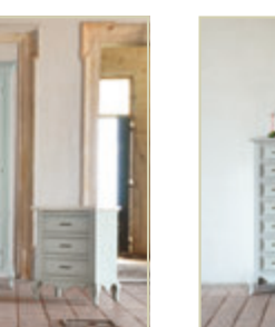
Art. 1548 - pag. 61