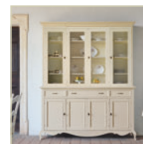
Art. 1510 - pag. 46 Art. 1514A - pag. 46