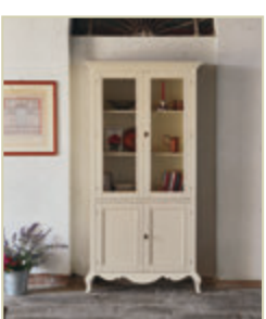
Art. 1519 - pag. 59