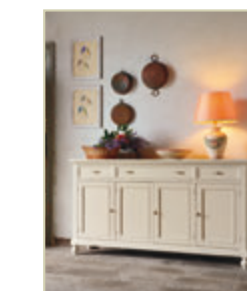
Art. 1220 - pag. 23