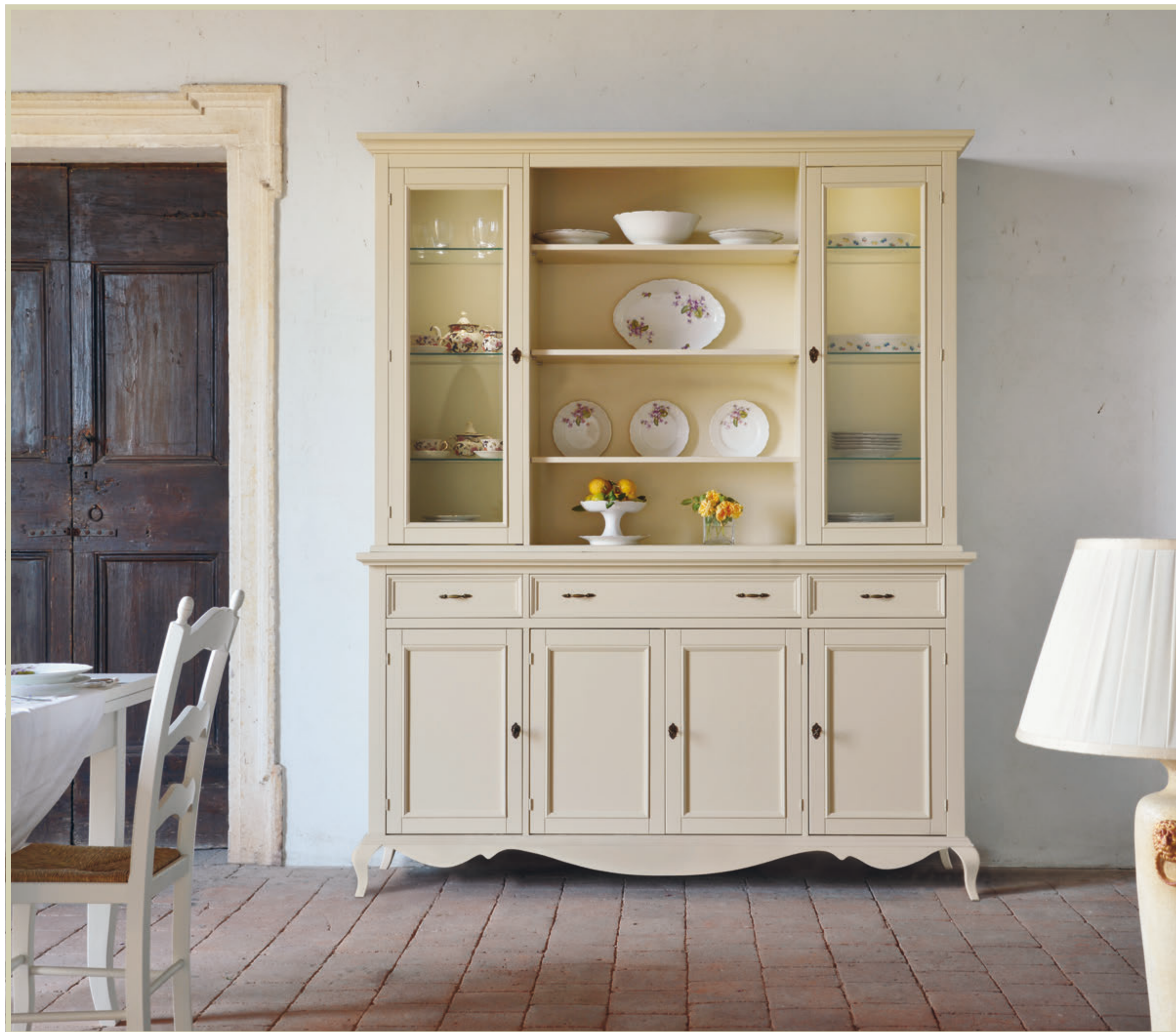
Art. K2 Kit 2 faretti a led Kit 2 LED spotlights