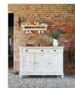
Art. 1210 - pag. 17 Art. 1275 - pag. 17