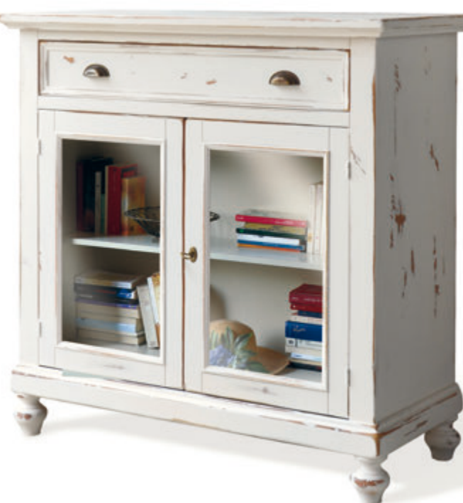
Art. 1201 credenza 2 ante vetro 2 glass doors cupboard L. 103 P. 46 H. 105 fin. bianco shabby

apore di mosto che invadeva la cucina e il tinello mentre il profumo del caffè caldo fuoriusciva dalla caffettiera ormai logora. Il mobile consumato dal