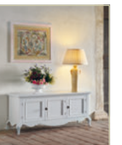
Art. 1545 - pag. 50