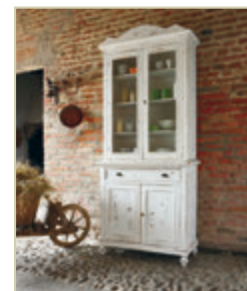
Art. 1200 - pag. 11 Art. 1232C - pag. 11