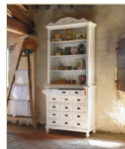
Art. 1205 - pag. 12 Art. 1234C - pag. 12