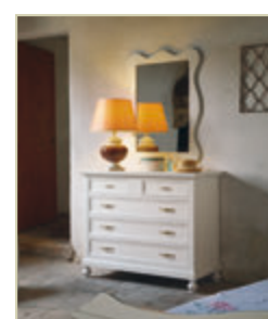
Art. 1300 - pag. 33 Art. 1321 - pag. 33