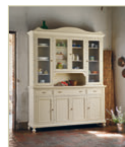
Art. 1220 - pag. 19 Art. 1252C - pag. 19