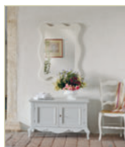
Art. 1540 - pag. 49 Art. 1321 - pag. 49