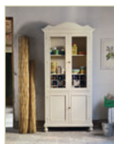
Art. 1260C - pag. 24