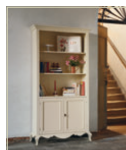
Art. 1518 - pag. 58