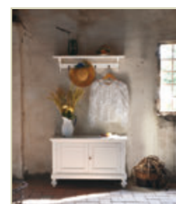
Art. 1273 - pag. 13 Art. 1274 - pag. 13