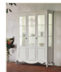
Art. 1532 - pag. 53