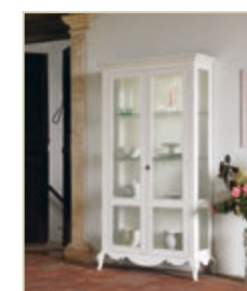
Art. 1524 - pag. 55