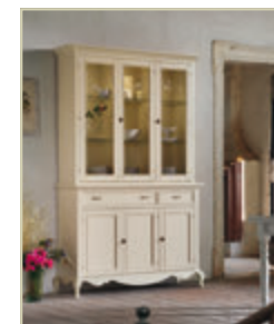
Art. 1505 - pag. 42 Art. 1513 - pag. 42