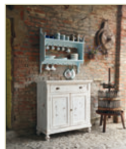
Art. 1200 - pag. 6 Art. 1276 - pag. 6