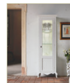
Art. 1522 - pag. 53