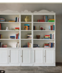
Art. 1291C/1296C/1291C - pag. 29