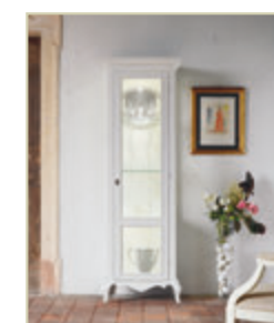
Art. 1520 - pag. 55