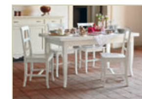
Art. 4100 160x85 - pag. 45 Art. 4554B - pag. 45