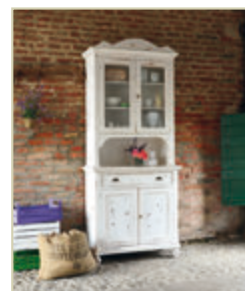
Art. 1200 - pag. 10 Art. 1230C - pag. 10