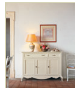
Art. 1505 - pag. 42