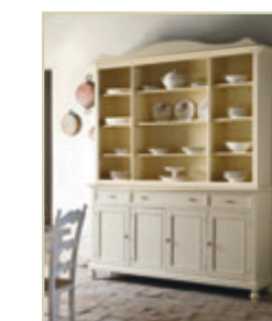
Art. 1220 - pag. 22 Art. 1256C - pag. 22