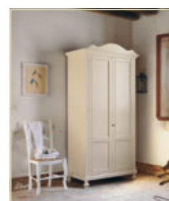
Art. 1302C - pag. 32 Art. 4567 - pag. 32