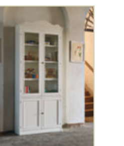
Art. 1292C - pag. 28