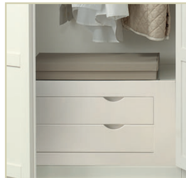
Art. 734E20 cassettiera interna per art. 1302C/1302CS chest for art. 1302C/1302CS