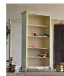
Art. 1517 - pag. 56