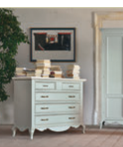
Art. 1550/1555/1551 - pag. 60/61