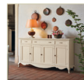
Art. 1510 - pag. 44