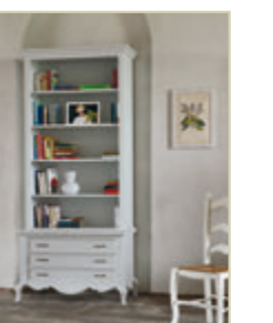
Art. 1541 - pag. 51 Art. 1543 - pag. 51