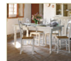
Art. 4100 160X85 - pag. 20 Art. 4567 - pag. 20